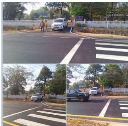
วันที่ ๑๔ มี.ค.๖๗ เวลา ๐๗.๐๐น.-๐๘.๐๐น. เข้า ร.ต.ท. ปัญญา มีทรัพย์ ออก ว.๔ การจราจรหน้า รร.บ้านหินโงม เหตุการณ์ปกติ