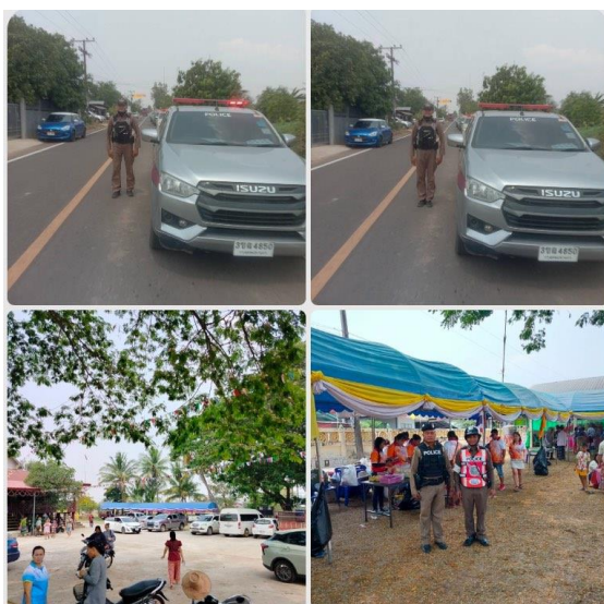
วันที่ ๑๖ มีนาคม ๒๕๖๗ เวลา ๑๑.๓๐ น ร้อยเวร ๒๐ สายตรวจจราจร ว๔ งานบุญมหาชาติบ้าน ถ่อนใหญ่เหตุการณ์ปกติจึงเรียนมาเพื่อโปรดทราบ