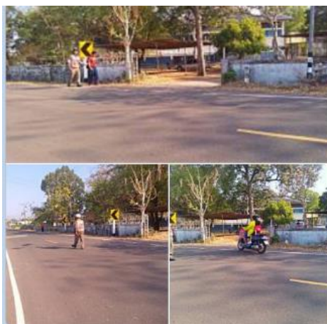
วันที่ ๑๓ มี.ค.๖๗ เวลา๐๗.๐๐น.-๐๘.๐๐น. ร.ต.ท.ปัญญา มีทรัพย์ อำนวยความสะดวกด้านการจราจร ช่วยนักเรียนในการข้ามถนน บริเวณหน้า โรงเรียนบ้านโนนตู