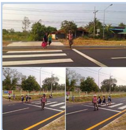
วันที่ ๑๒มี.ค.๖๗ เวลา๐๗.๐๐น.-๐๘.๐๐น. ร.ต.ท.ปัญญา มีทรัพย์ อำนวยความสะดวกด้านการจราจร ช่วยนักเรียนในการข้ามถนน บริเวณหน้า โรงเรียนบ้านเหล่าพรวน เหตุการณ์ปกติ