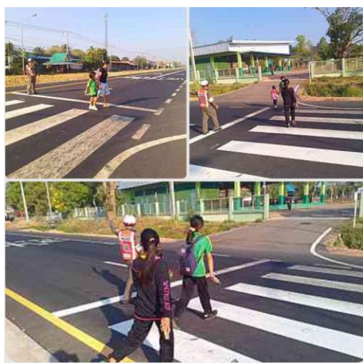
วันที่ ๖ มี.ค.๖๗ เวลา ๐๗.๐๐น. - ๐๘.๐๐น. ร.ต.ท.ปัญญา มีทรัพย์ อำนาจความสะดวกด้าน การจราจร ช่วยนักเรียนในการข้ามถนน บริเวณหน้า โรงเรียนบ้านเหล่าพรวน