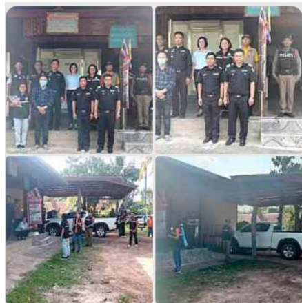
วันที่ ๑๙ ตุลาคม ๒๕๖๖ ร้อยเวร ๒๐ ,สายตรวจ ร่วมกับปศุสัตว์จังหวัด ตรวจเนื้อสัตว์ในพื้นที่