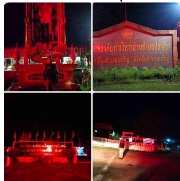
31 ตุลาคม 2566

สรุปผลการปฏิบัติงานป้องกันปราบปรามอาชญากรรมของสถานีตำรวจในสังกัด ผ่านระบบ Police 4.0